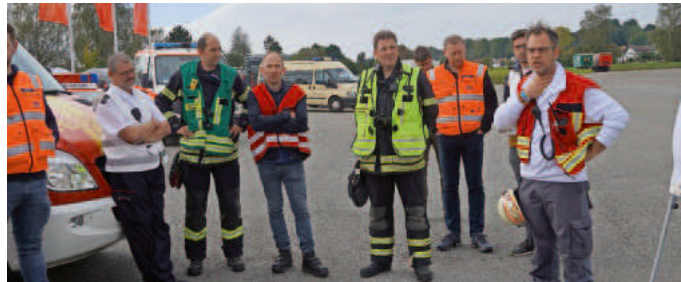
Das Übungsszenario - eine Kollision zwischen einem Schulbus und einem Zug - hat viele Verletzte zur Folge. Die Einsatzkräfte reanimieren, retten und halten regelmäßig Lagebesprechungen ab, um den Überblick zu behalten.