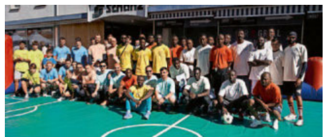
Alle Teams spielen für einen guten Zweck.